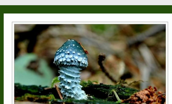
Koperzwam: gefotografeerd door Gerrit Oost