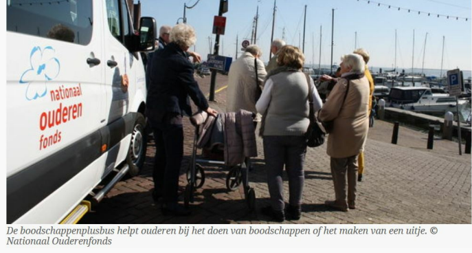
De boodschappenplusbus helpt ouderen bij het doen van boodschappen of het maken van een uitje.